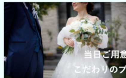
当日ご用意した こだわりのブーケ

結婚式で使用したブーケやサプライズで 頂いた花束を押し花やドライフラワー として仕上げたブーケのこと♪ 新居に飾ったりなど人気急上昇!! 当日の思い出をカタチに残せるアイテム