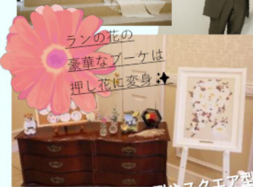
ランの花の 豪華なブーケは 押し花に変身♪