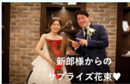
新郎様からの サプライズ花束♥