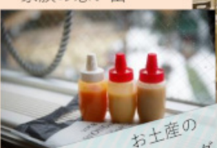
お土産の ドレッシング♪