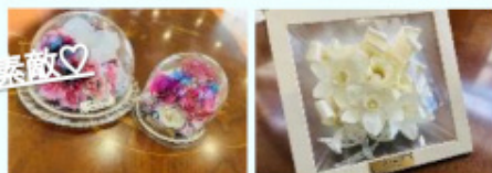
よりリアルに ブートニアも合わせて 二人の思い出に♪