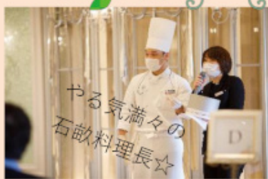
やる気満々の 石畝料理長☆