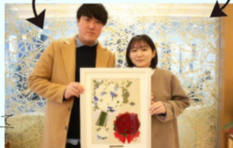
結婚式の思い出が カタチになって お二人の手に♡ 幸せな瞬間を これからも一緒に